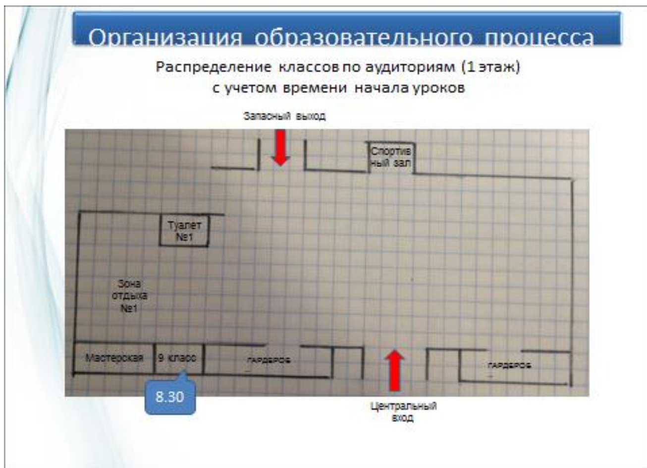
СХЕМА ЗАКРЕПЛЕНИЯ МЕСТ ОТДЫХА (ЗОНИРОВАНИЕ КОРИДОРОВ), ТУАЛЕТНЫХ КОМНАТ